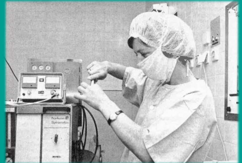
„Die Schwester“, Eine Zeitschrift für Krankenpflege, 1976